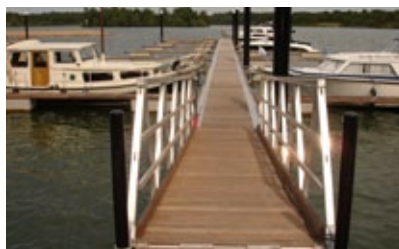
Toegangsbrug Vakantiepark Leukermeer